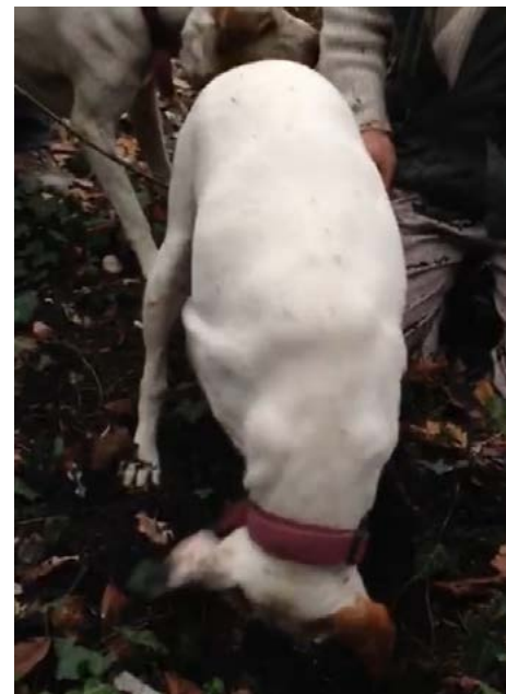
Caça das trufas brancas em Piemonte: tradição que exige licença e cachorros treinados